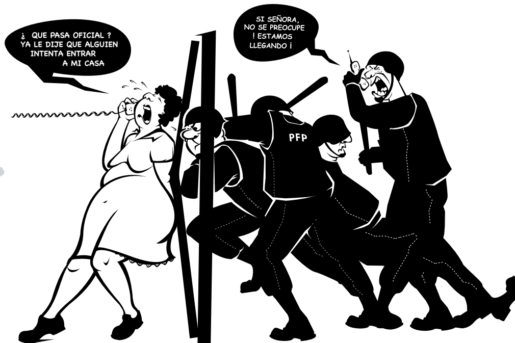
CARICATURA: Victor Coscacauhtli / Palabras de la Otra

por eso desean callar nuestra voz y nos ignoran aparentado que no existimos. Se disponen a exterminarnos. Así como lo que les pasó a los compañeros de Atenco el 3 y 4 de mayo. Pasó en Atenco porque ellos no convienen, porque ellos no encajan, porque son personas diferentes que decidieron luchar por su espacio, por construir su vida, por hacer su propia historia con dignidad. Pensaron que los iban a acabar y así como ellos resisten, nosotros no callamos porque si lo hacemos eso que paso pasara en otros lados, es por eso que no des-cansaremos hasta terminar con este sistema, antes de que el nos extermine a todos.