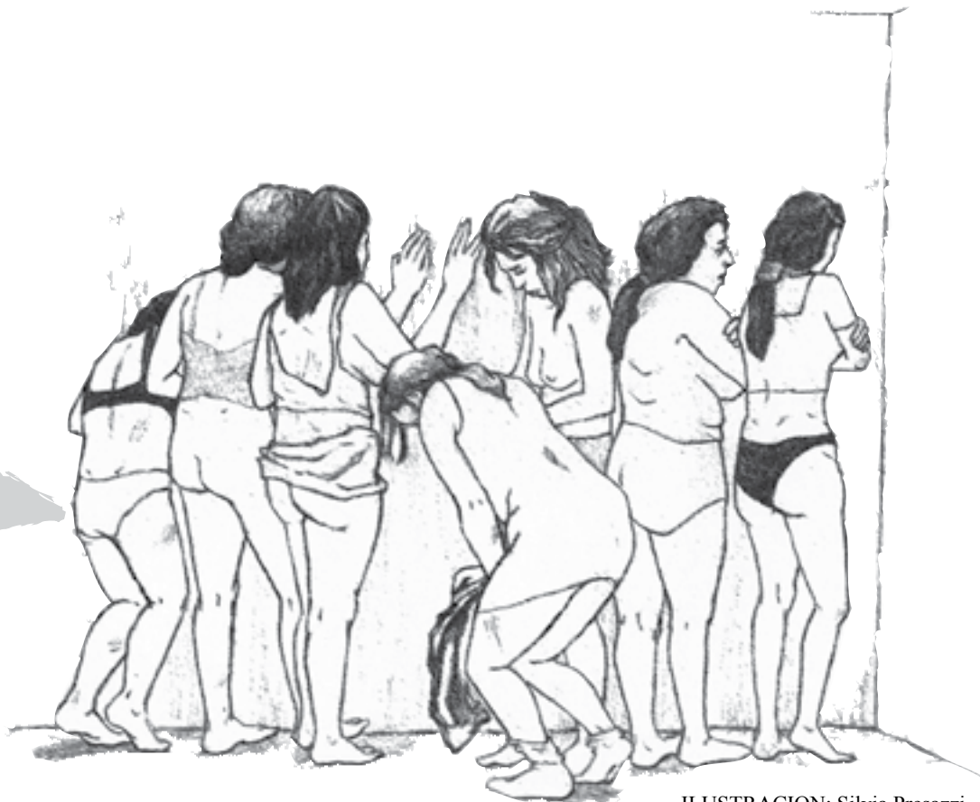
ILUSTRACION: Silvia Presazzi

La Otra Campaña tiene mucho trabajo por hacer. Hoy es posible afirmar, como lo ha hecho el Delegado Zero, que “tenemos ya una organización nacional de izquierda”. Todas y todos los adherentes estamos obligados a que este espacio de lucha sea muy otro porque en él contamos, al menos, con tres armas que ningún gobierno represor tiene: inteligencia, corazón y dignidad. Usemos esas armas y sigamos adelante.