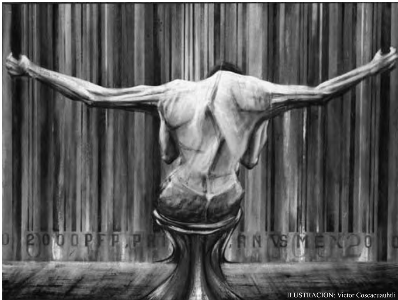
ILUSTRACION: Víctor Coscacuauhtli